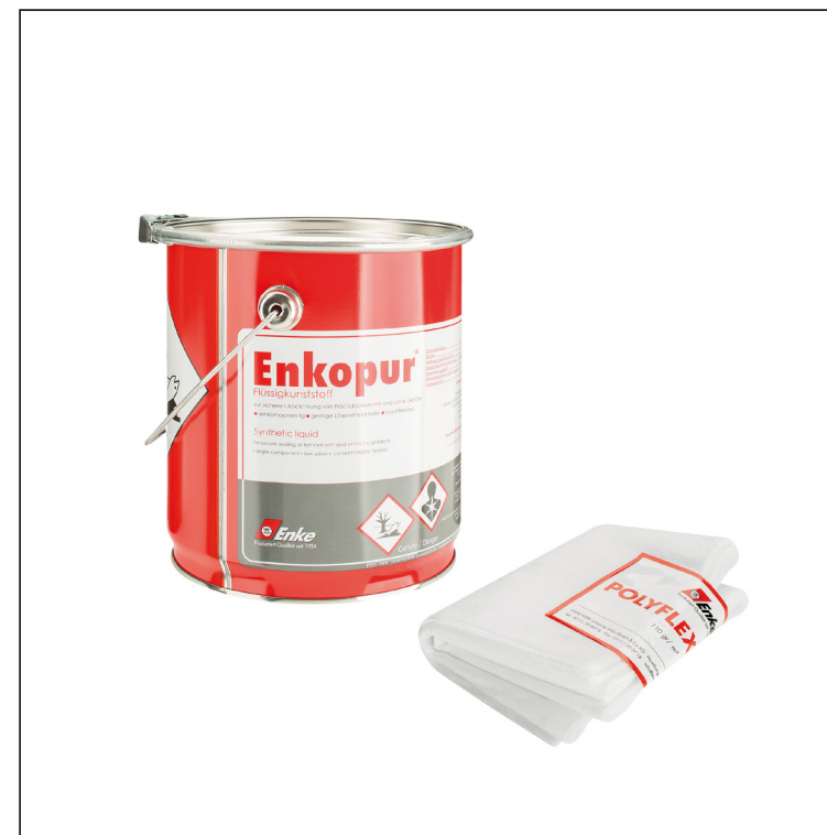
Enkopur : Polyuretánová živica – Šedá Polyflexvlies: Polyester – Biela