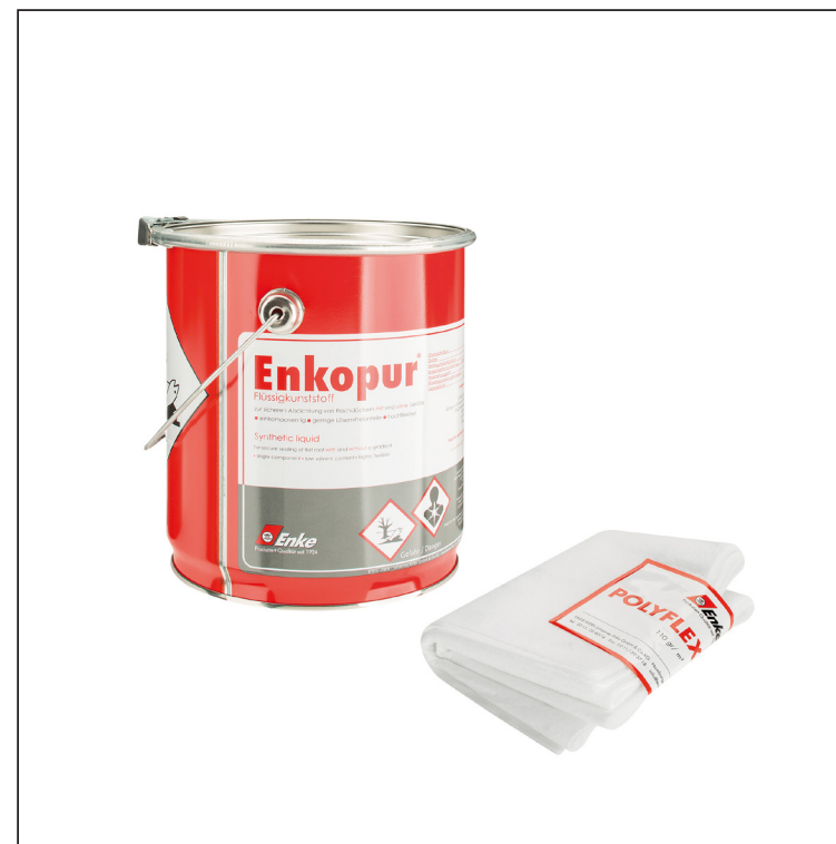
Enkopur : Polyuretánová živica – Šedá Polyflexvlies: Polyester – Biela