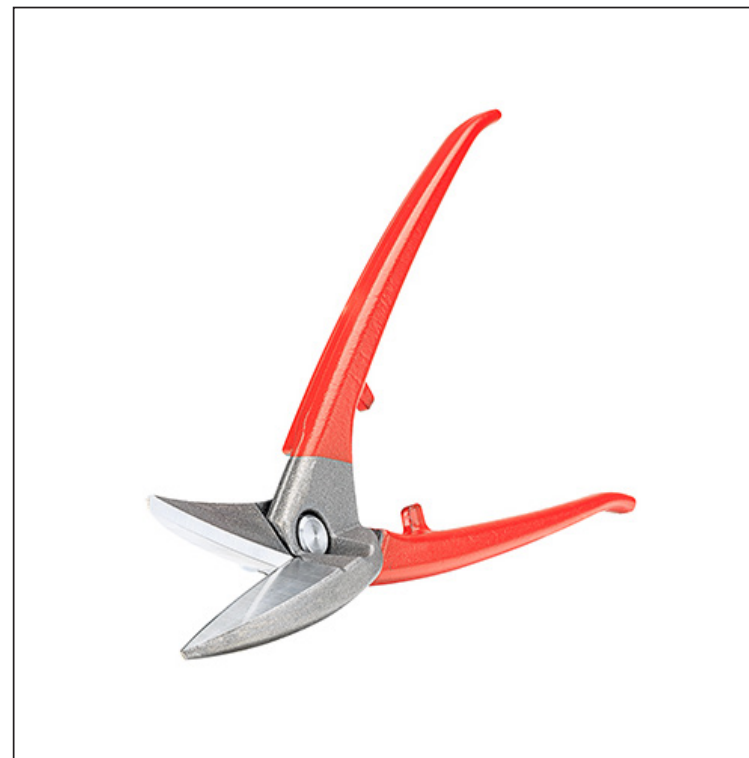
Vysokolegovaná nástrojová oceľ