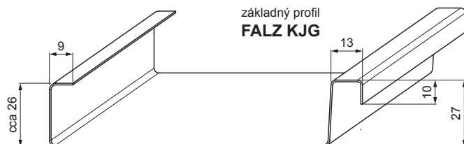
základný profil FALZ KJG