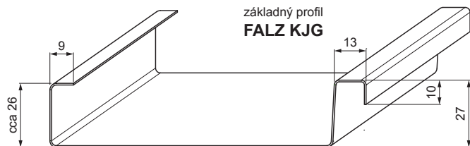
základný profil FALZ KJG